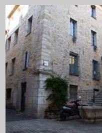
L'Artothèque à Valbonne

■ La brochure sur les galeries et univers artistiques de Valbonne sera rééditée en juin par l'Art Tisse.